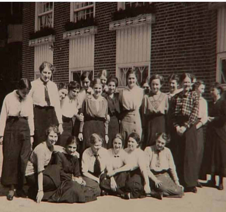
Schülerinnen der von Alice Salomon gegründeten Sozialen Frauenschule in Berlin-Schöneberg / Students of Alice Salomon's Social School for Wo- men in Berlin-Schöneberg