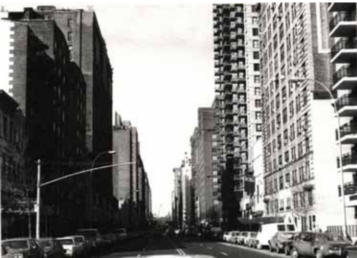
New York, 79. Straße – Alice Salomons letzter Wohnsitz / her last address

auch nach dem Krieg Jura und wurde dann Rechtsanwalt. Nach meiner Geburt im Jahr 1928 blieb meine Mutter zu Hause. Ob sie nach ihrer Heirat 1924 gearbeitet hat, weiß ich nicht. Meine Eltern genossen das Leben in Berlin in den 1920er-Jahren. Sie unterstützten die Weimarer Republik und die linke Politik. Mein Vater schrieb ein Buch, das er meiner Mutter widmete. Sie hatten Freunde, Geschwister, Eltern, große Familien – kurz: ein gutes soziales Netz.