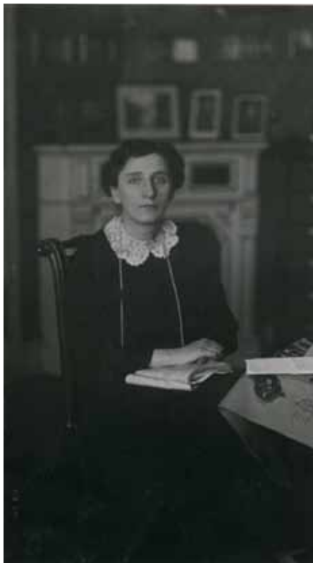
Alice Salomon 1908