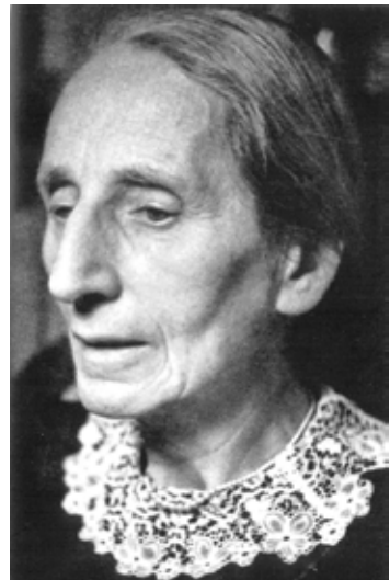
Alice Salomon 1942

When the opportunity came, I moved to Ber-