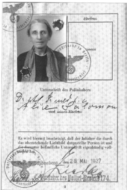
Der Reisepass / passport Alice Salomons