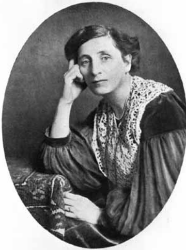
Alice Salomon 1914

gration. Mein Vater wusste, dass er seinen Beruf im Ausland nicht ausüben konnte, und er meinte, dass „es ihn nicht treffen würde“, weil er Veteran des Ersten Weltkriegs sei. Als sich die politische Situation verschlechterte, wurde er, wie ich glaube, depressiv, ebenso wie der bewunderte Bruder meiner Mutter, der 1937 Selbstmord beging. Danach fiel mein Vater wirklich in eine starke Depression, machte sich Vorwürfe wegen des Selbstmords meines Onkels und war mehrere Jahre in einer Klinik.